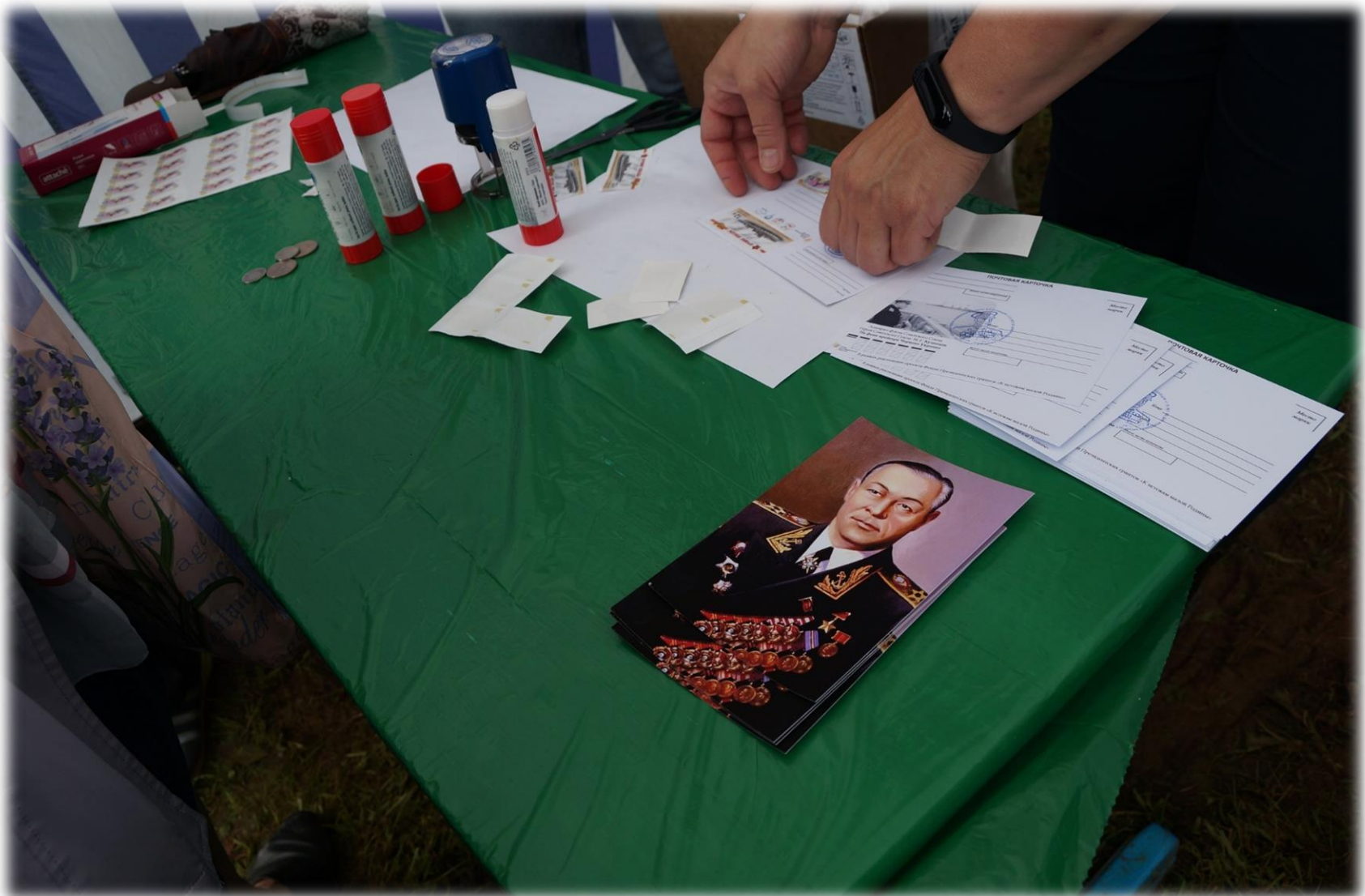
Площадка «Спецпогашение почтовых конвертов, открыток»