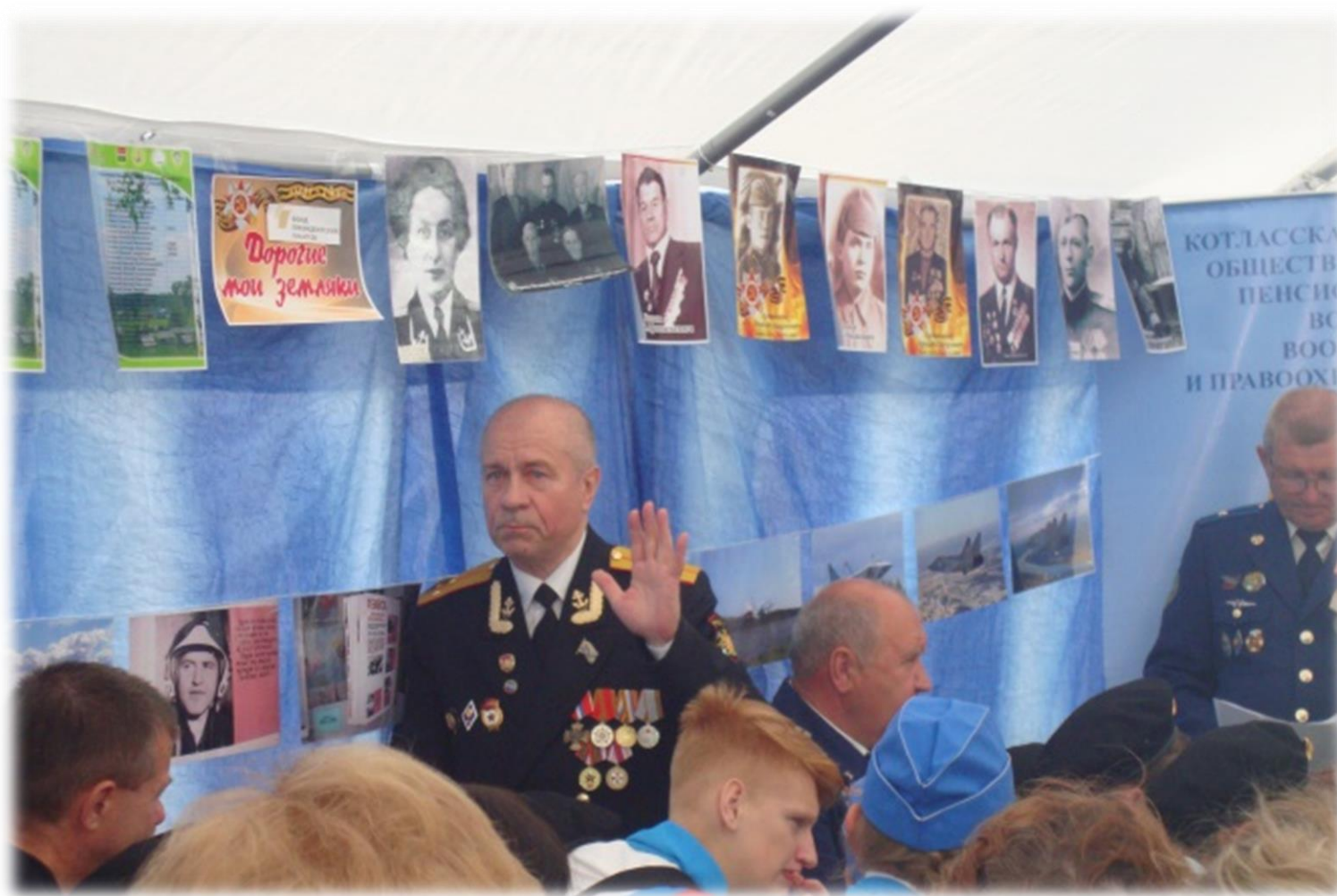
Дискуссионная площадка «Выбор сделан однажды»