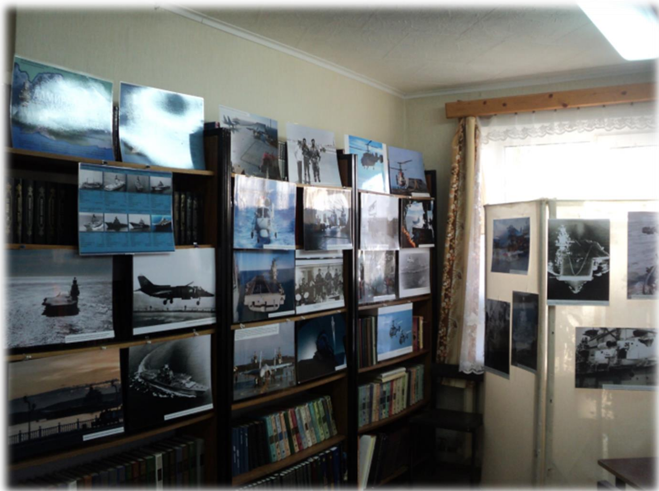
Приводинская библиотека Фотовыставка «Адмирал Кузнецов : море и небо»