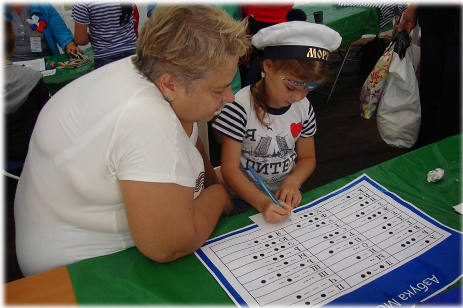
Познавательная площадка «Морская школа общения»