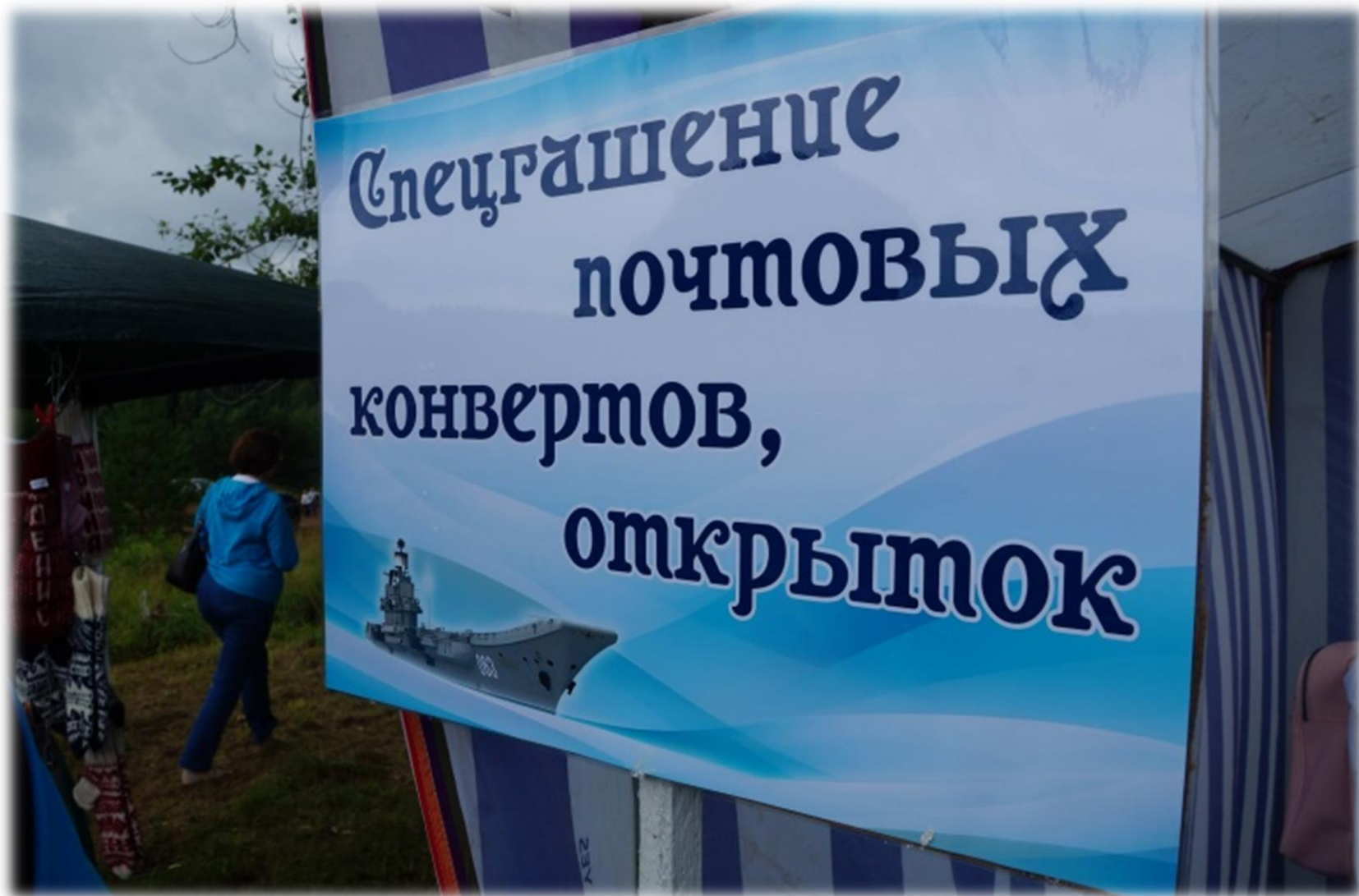
Площадка «Спецпогашение почтовых конвертов, открыток»