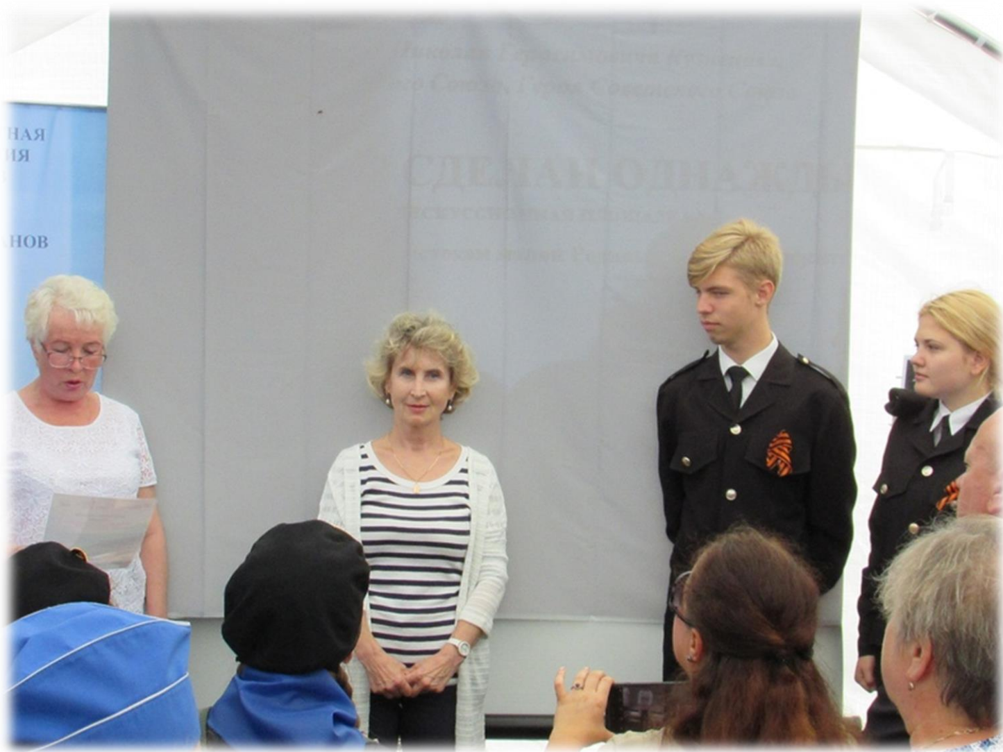
Дискуссионная площадка «Выбор сделан однажды»