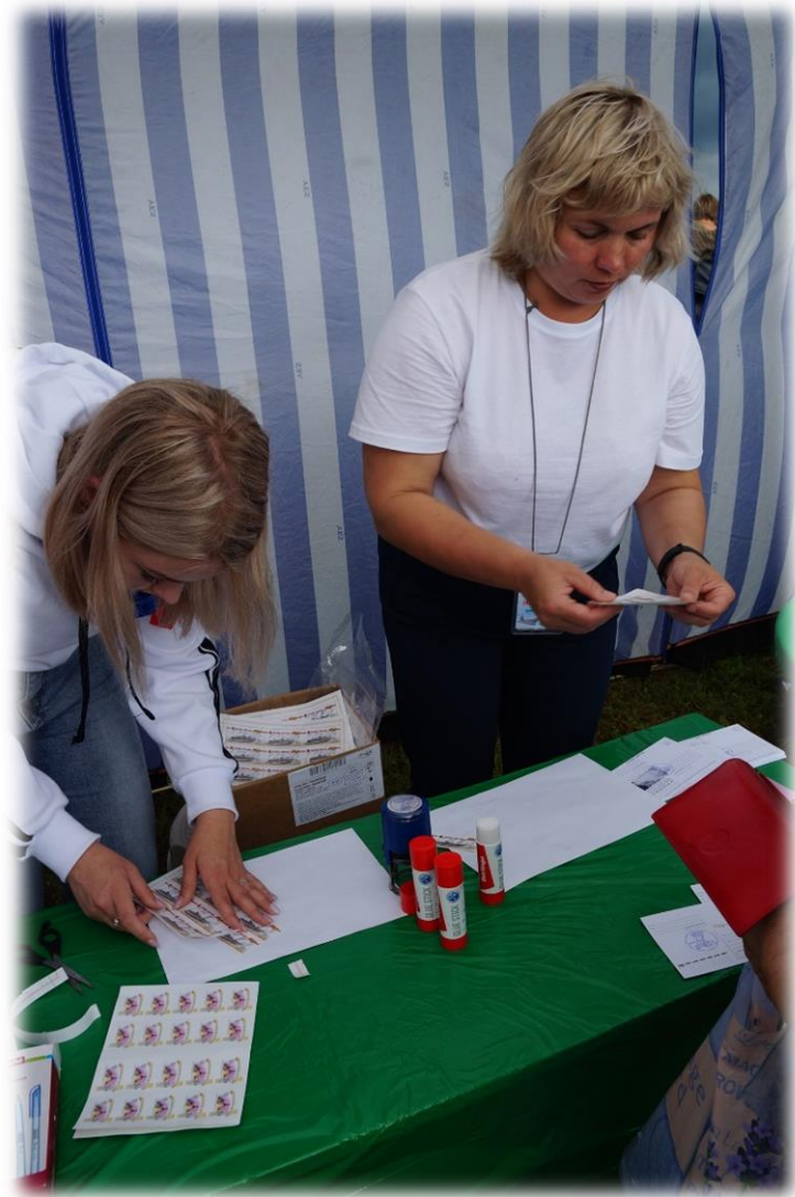
Площадка «Спецпогашение почтовых конвертов, открыток»