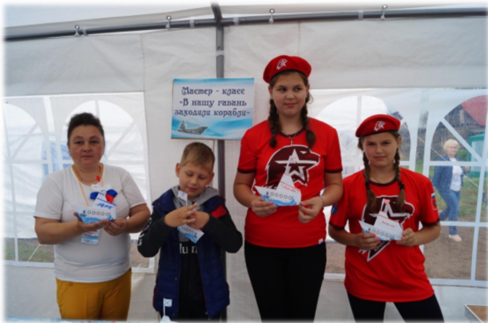
Мастер-класс «В нашу гавань заходили корабли»