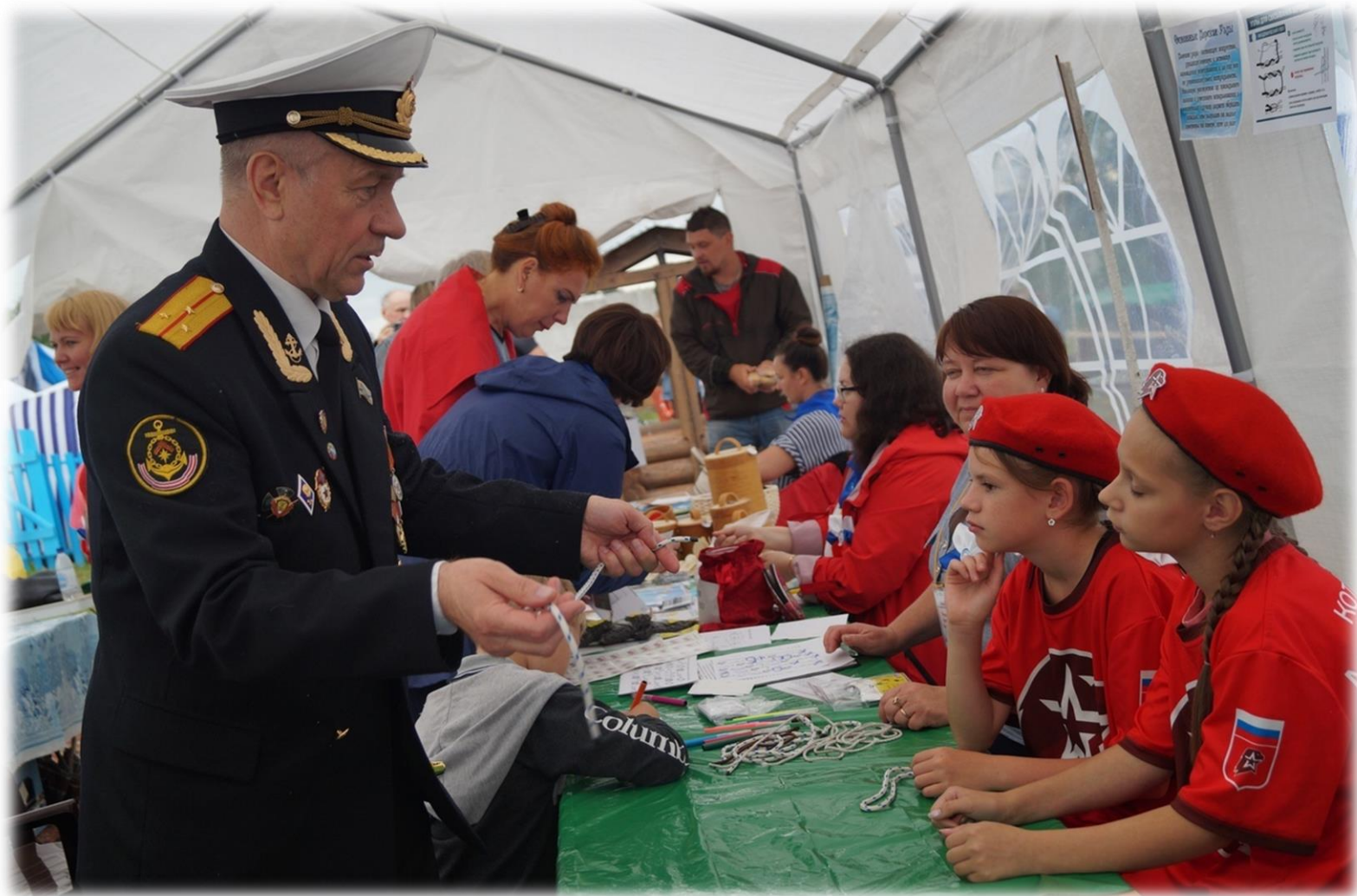
Познавательная площадка "Морской узел, или узелок завяжется»