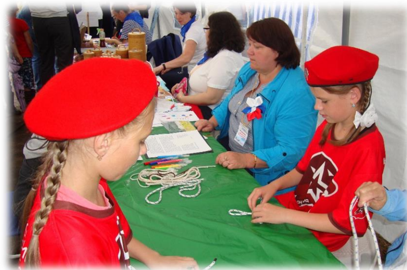
Юнармейцы из отряда «Аквилон», (организован при центральной библиотеке)