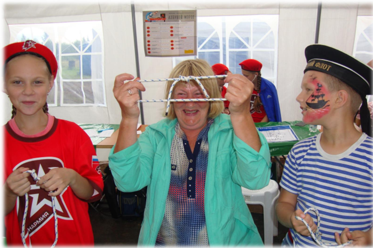
Познавательная площадка "Морской узел, или узелок завяжется»