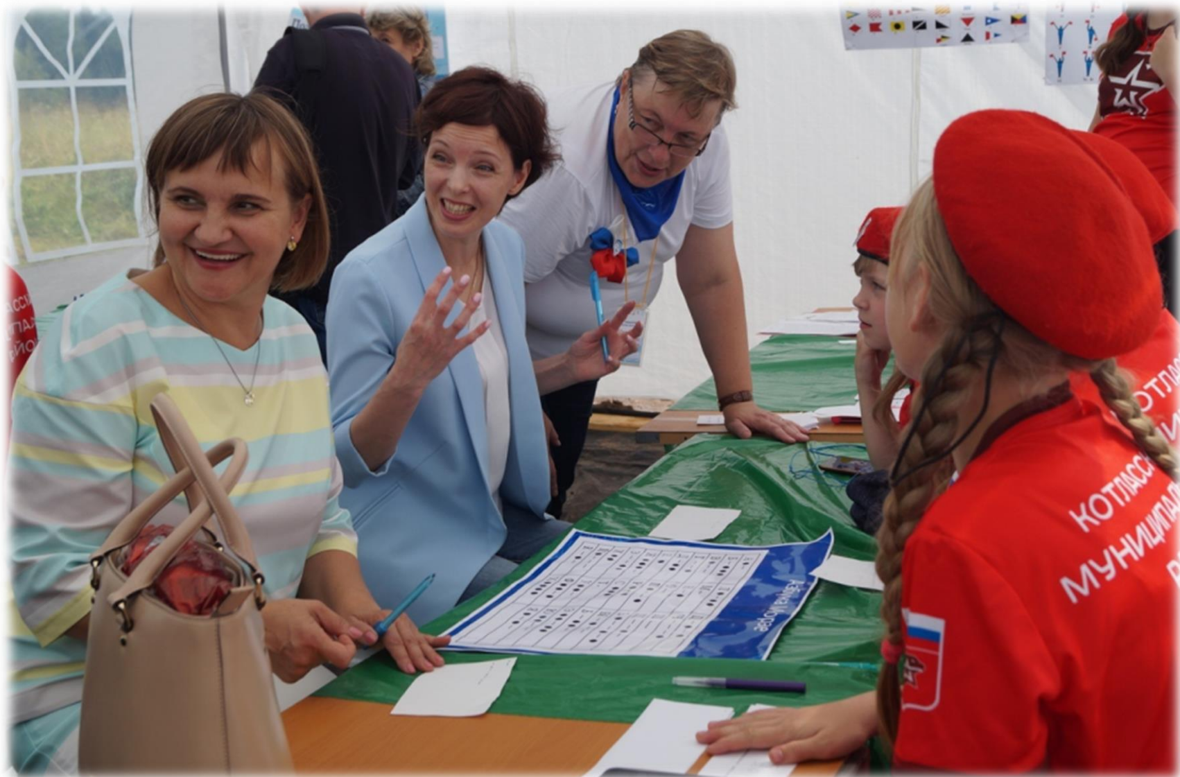
Познавательная площадка «Морская школа общения»