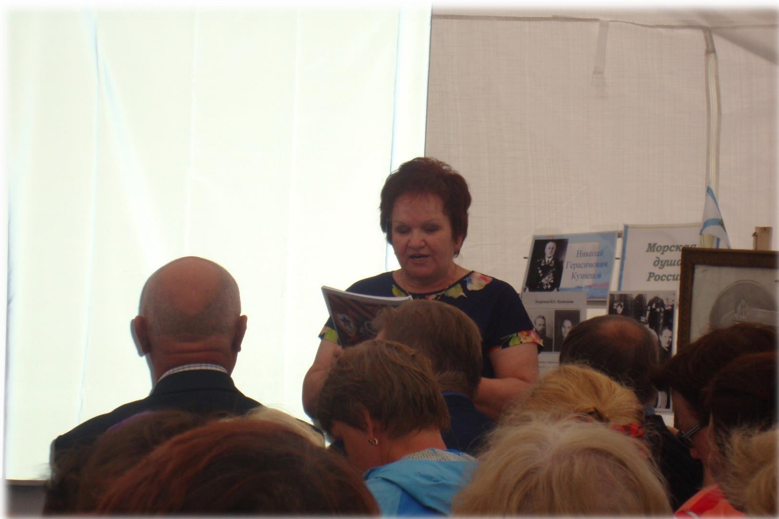
Дискуссионная площадка «Выбор сделан однажды»