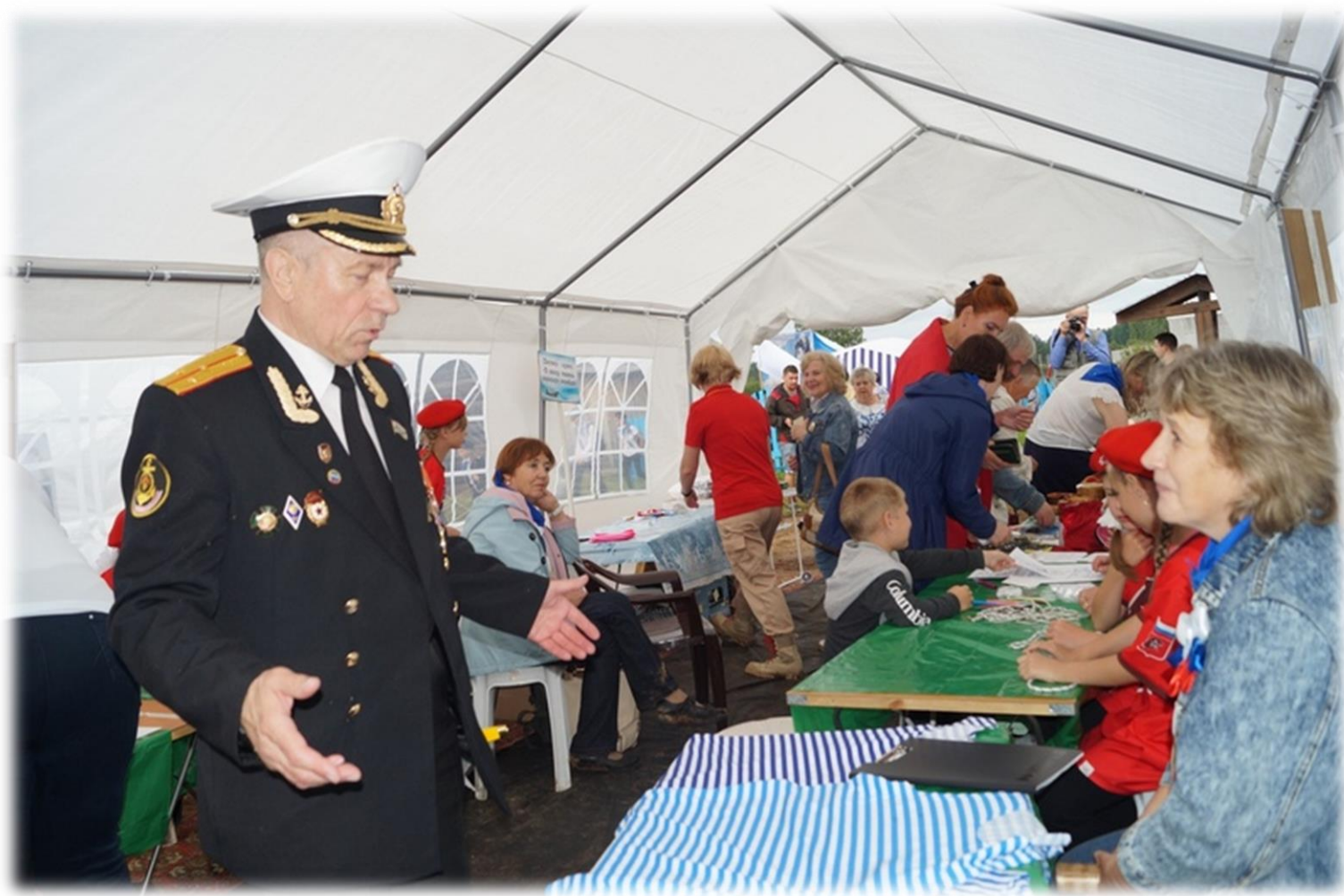
Познавательная площадка «Морская душа»