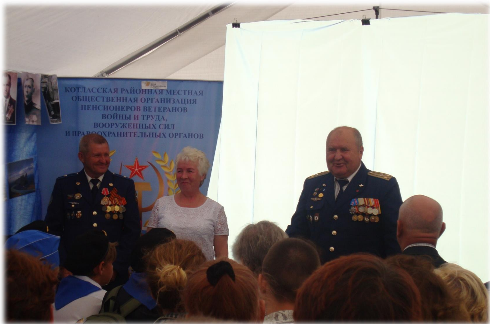
Дискуссионная площадка «Выбор сделан однажды»