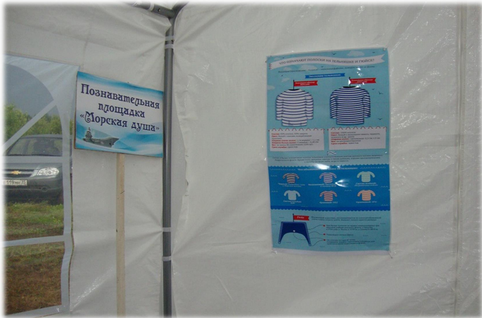
Познавательная площадка «Морская душа»