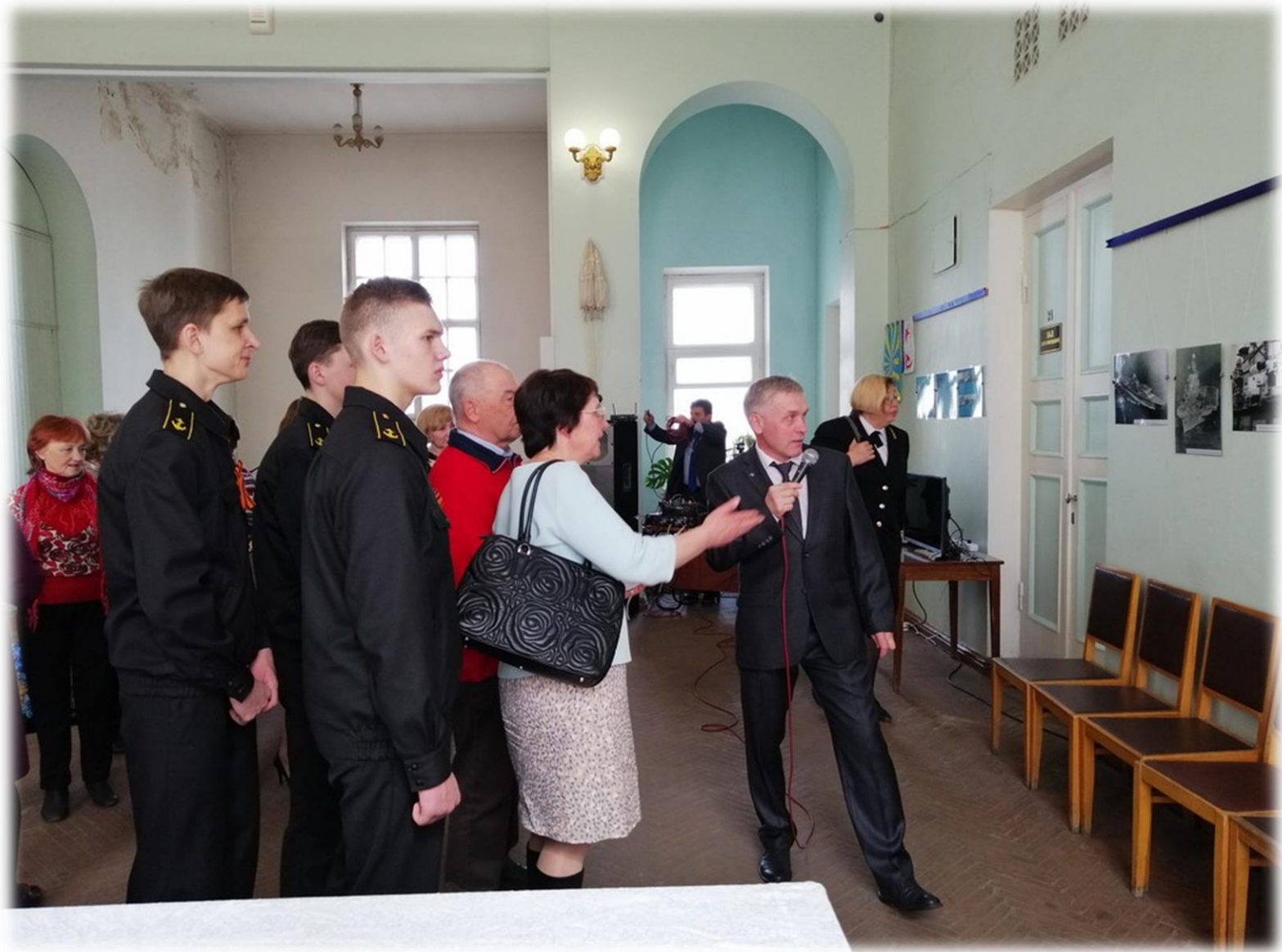
Открытие фотовыставки в администрации МО «Котласский муниципальный район».