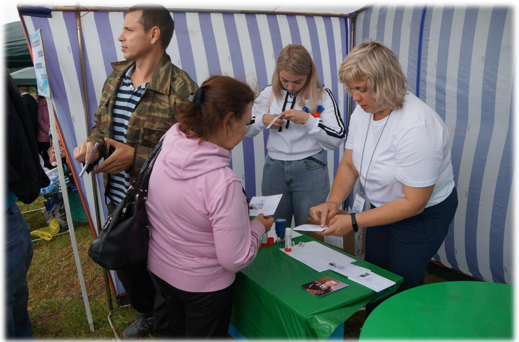
Площадка «Спецпогашение ПОЧТОВЫХ КОНВЕРТОВ, ОТКРЫТОК»