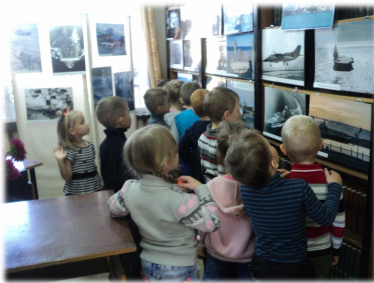
Приводинская библиотека Фотовыставка «Адмирал Кузнецов : море и небо»