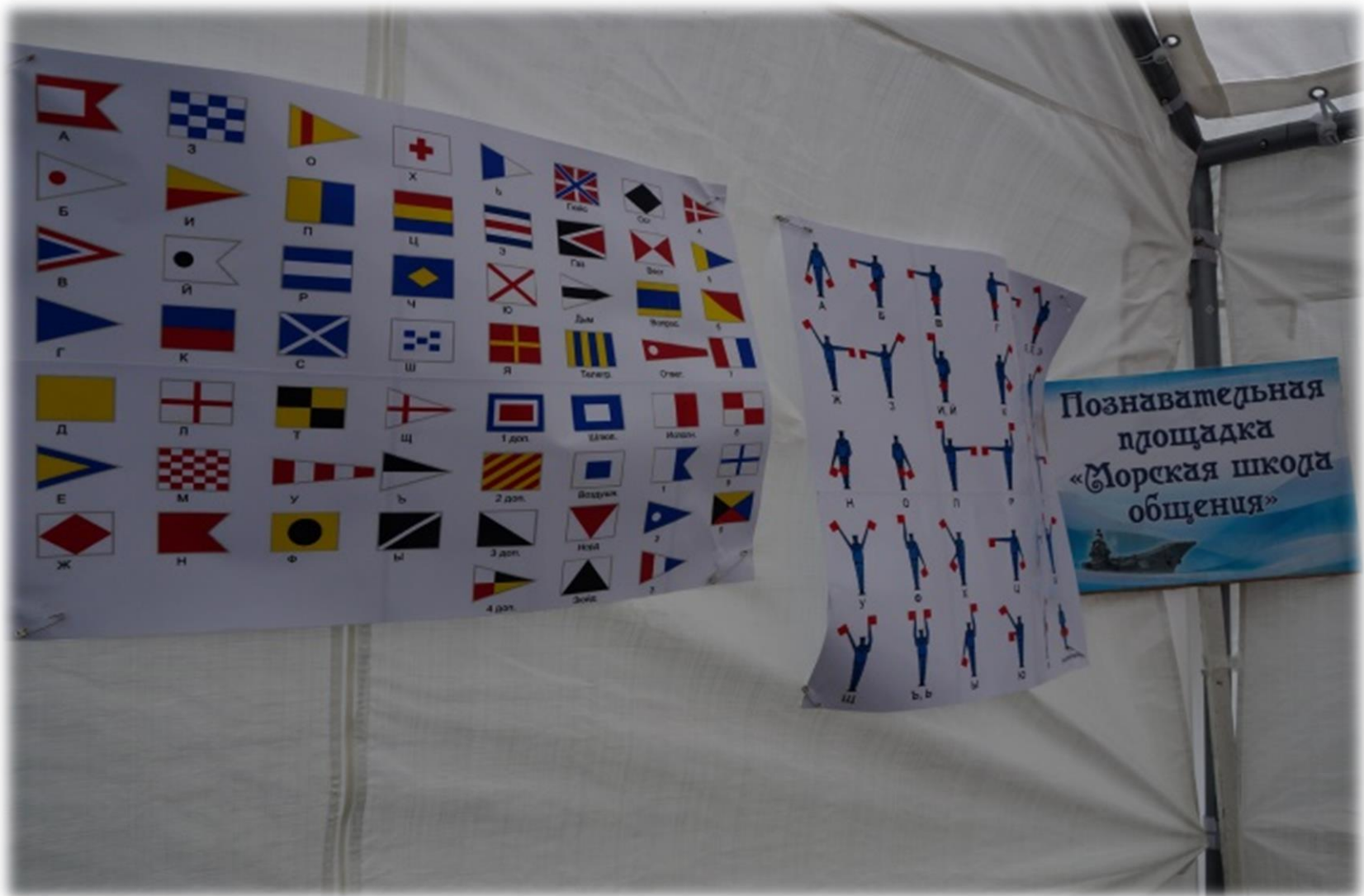
Познавательная площадка «Морская школа общения»