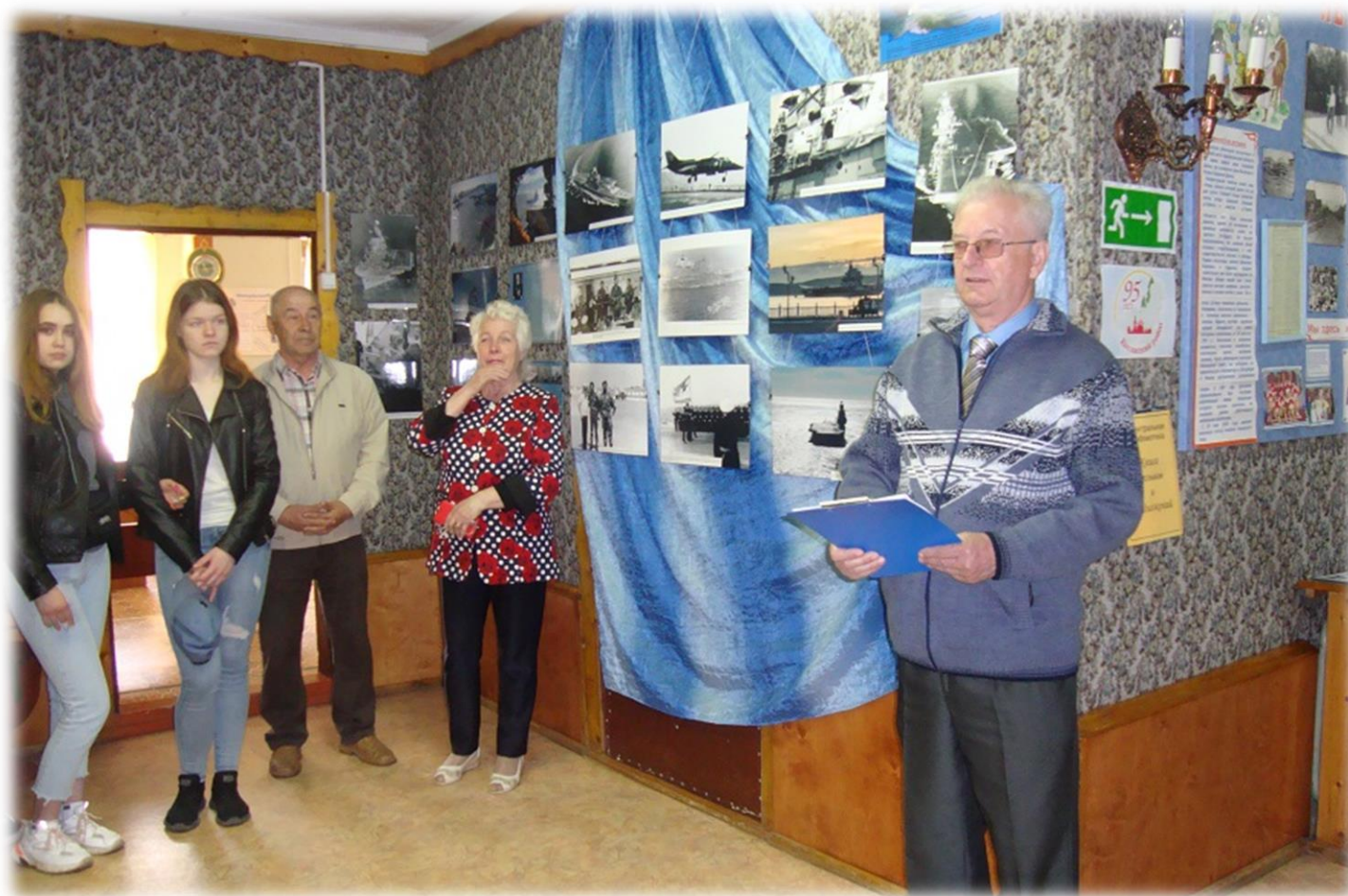
Центральная библиотека: открытие фотовыставки «Адмирал Кузнецов: море и небо» и филателистической выставки «Судьба, беспокойная, как море»