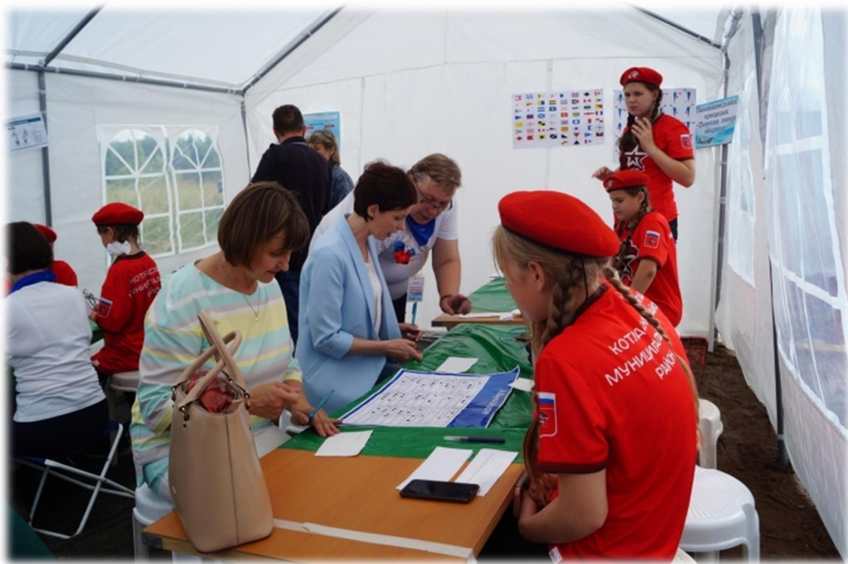
Познавательная площадка «Морская школа общения»