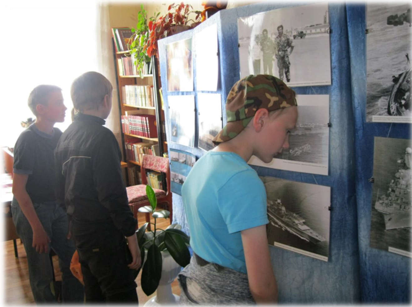
Шипицынская детская библиотека Фотовыставка «Адмирал Кузнецов : море и небо»