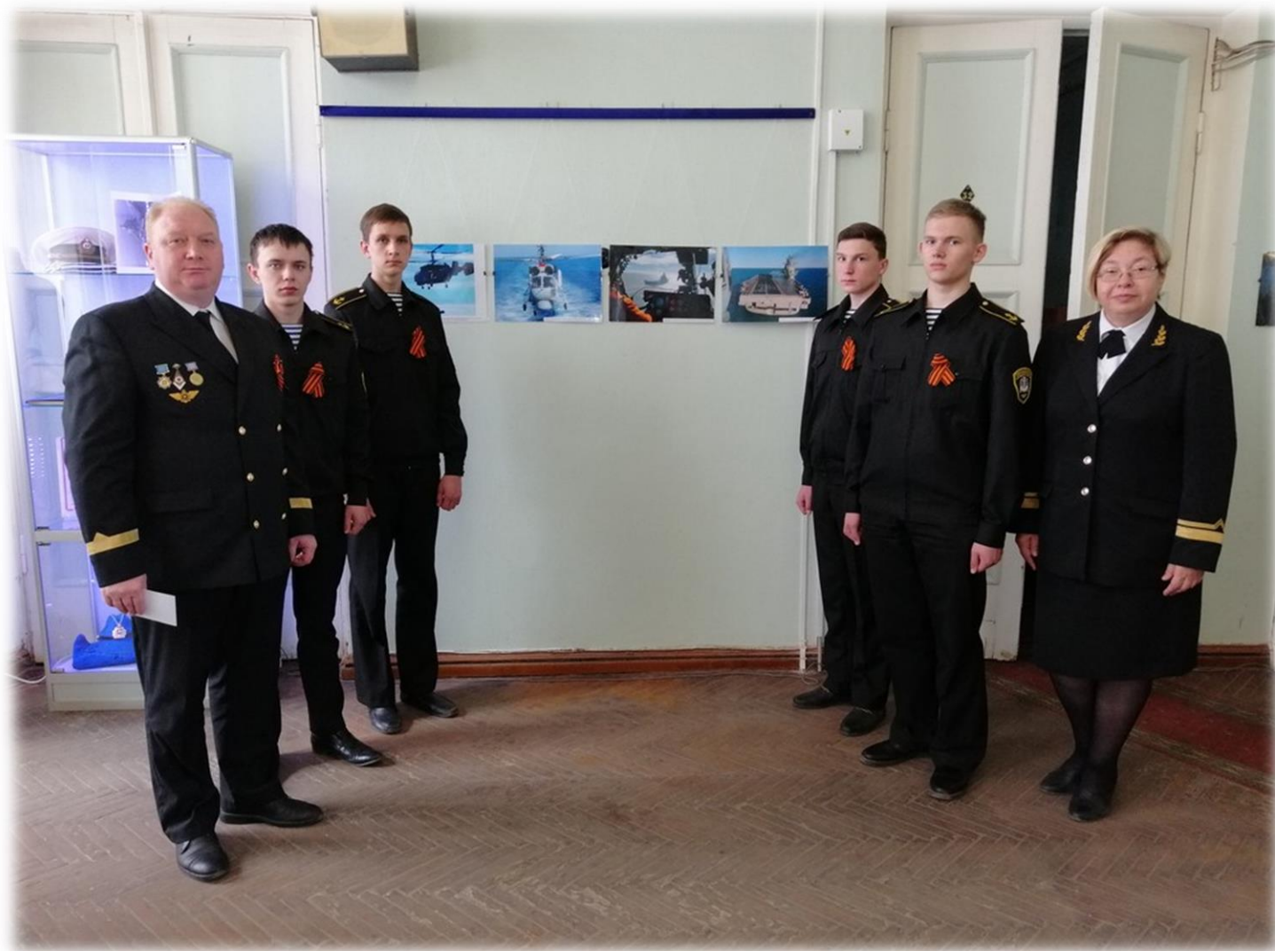
Открытие фотовыставки в администрации МО «Котласский муниципальный район».