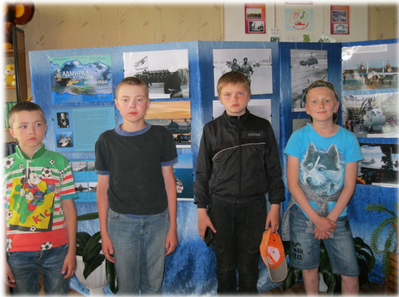
Шипицынская детская библиотека Фотовыставка «Адмирал Кузнецов : море и небо»