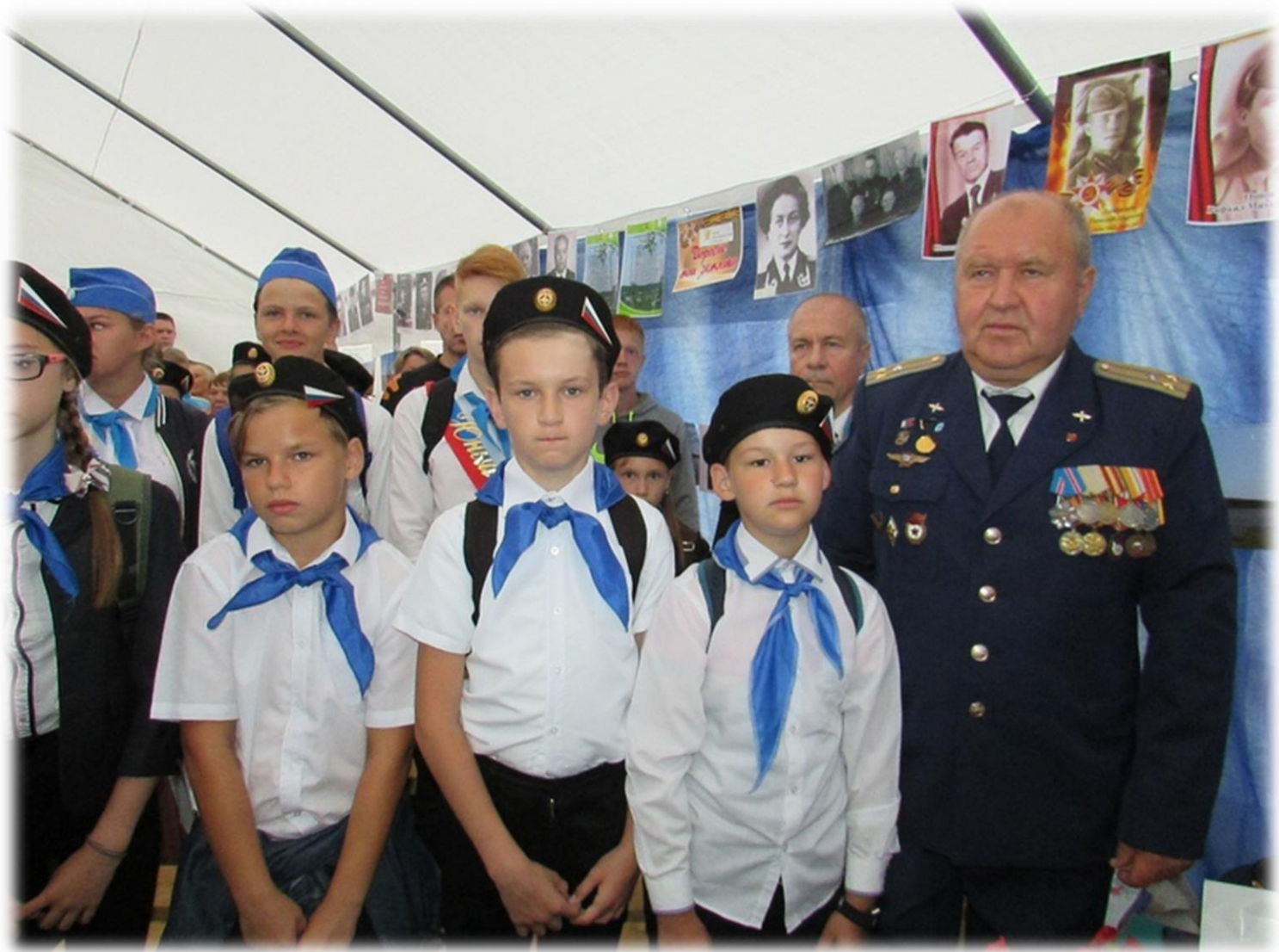
Дискуссионная площадка «Выбор сделан однажды»