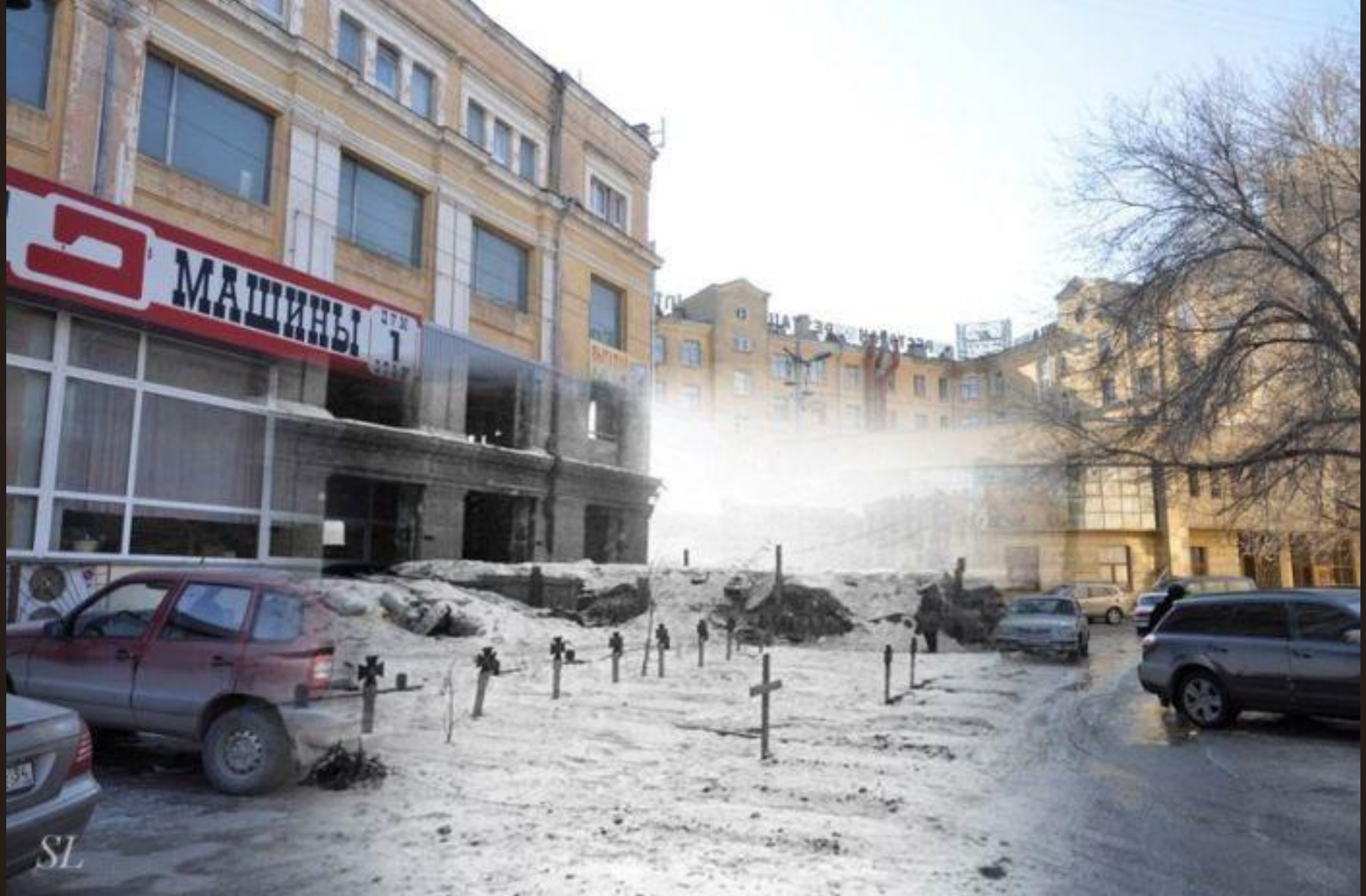
Немецкие захоронения у Универмага