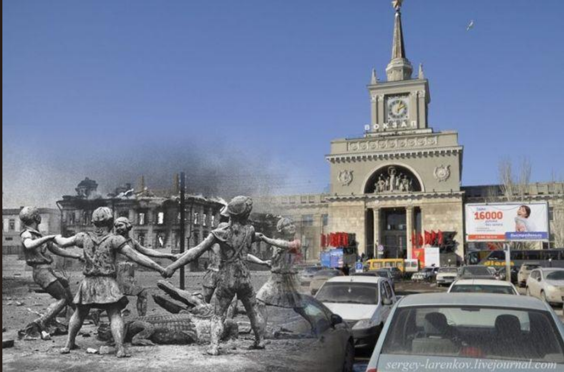
Привокзальная площадь. Фонтан "Детский хоровод".