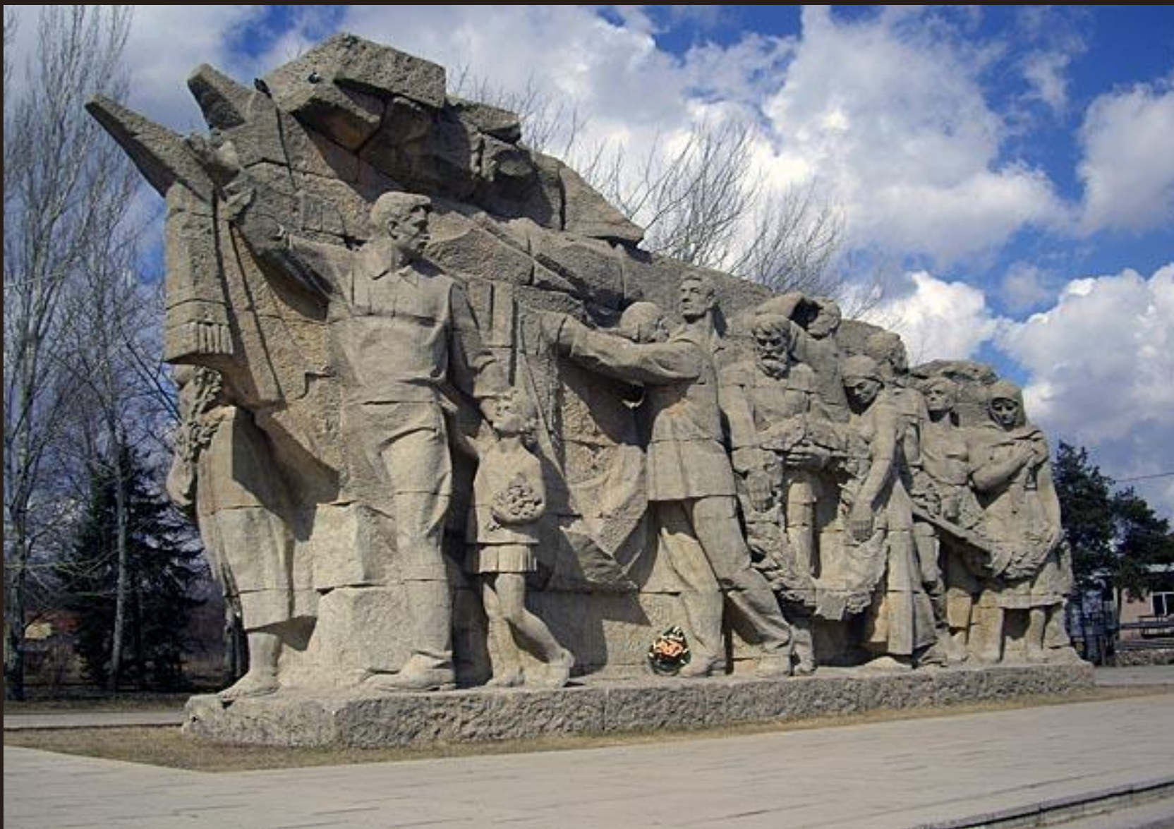
У входа на Мамаев курган. Скульптура «Память поколений».