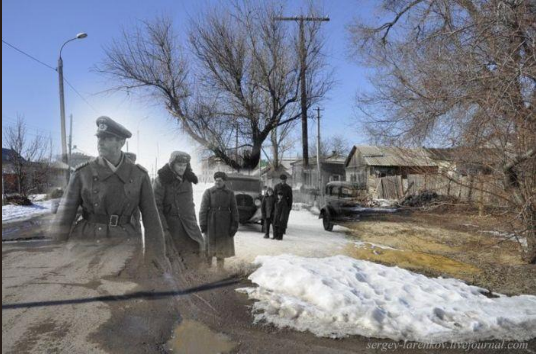
Паулюс после сдачи в плен перед первым допросом у штаба 64-й армии.