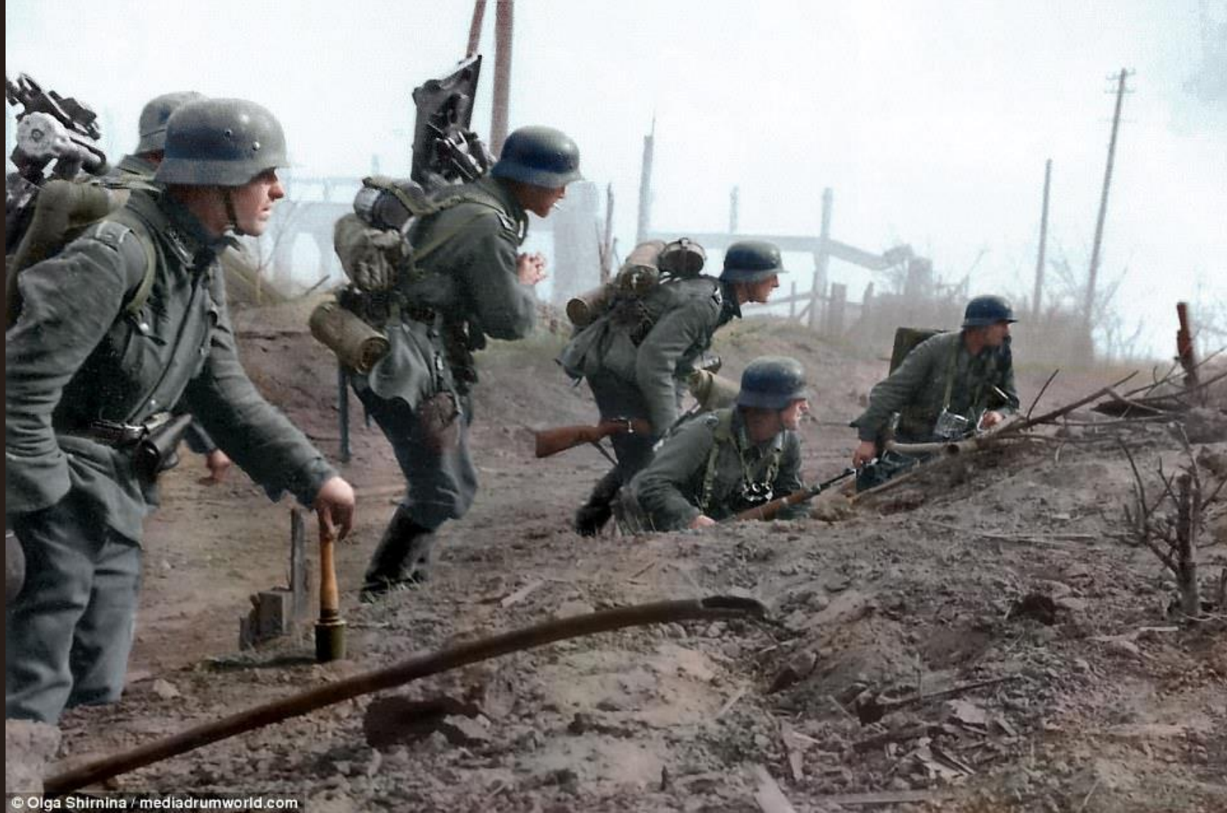
Солдаты 6-й армии вермахта в пригороде Сталинграда, конец сентября 1942 года.