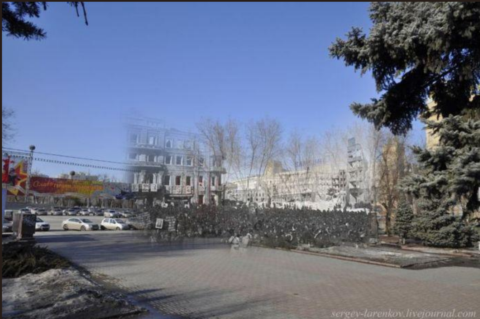
Митинг на площади Павших Борцов после разгрома немецкой группировки