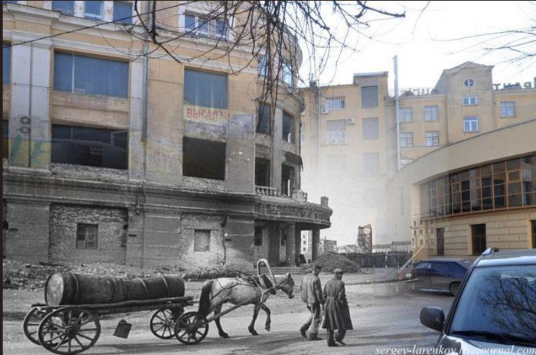
У здания Универмага. Именно здесь, в подвале, впервые в истории в плен сдался немецкий фельдмаршал