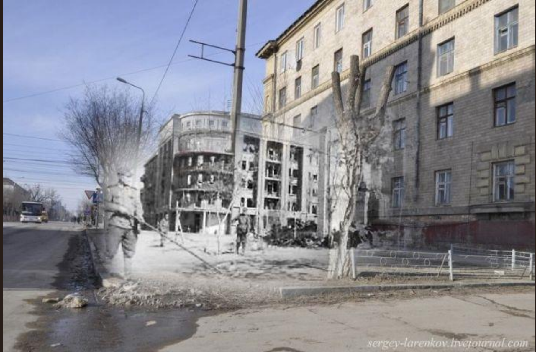
Ул. Огарева. Разминирование На фото еще один из уцелевших домов - Дом грузчиков