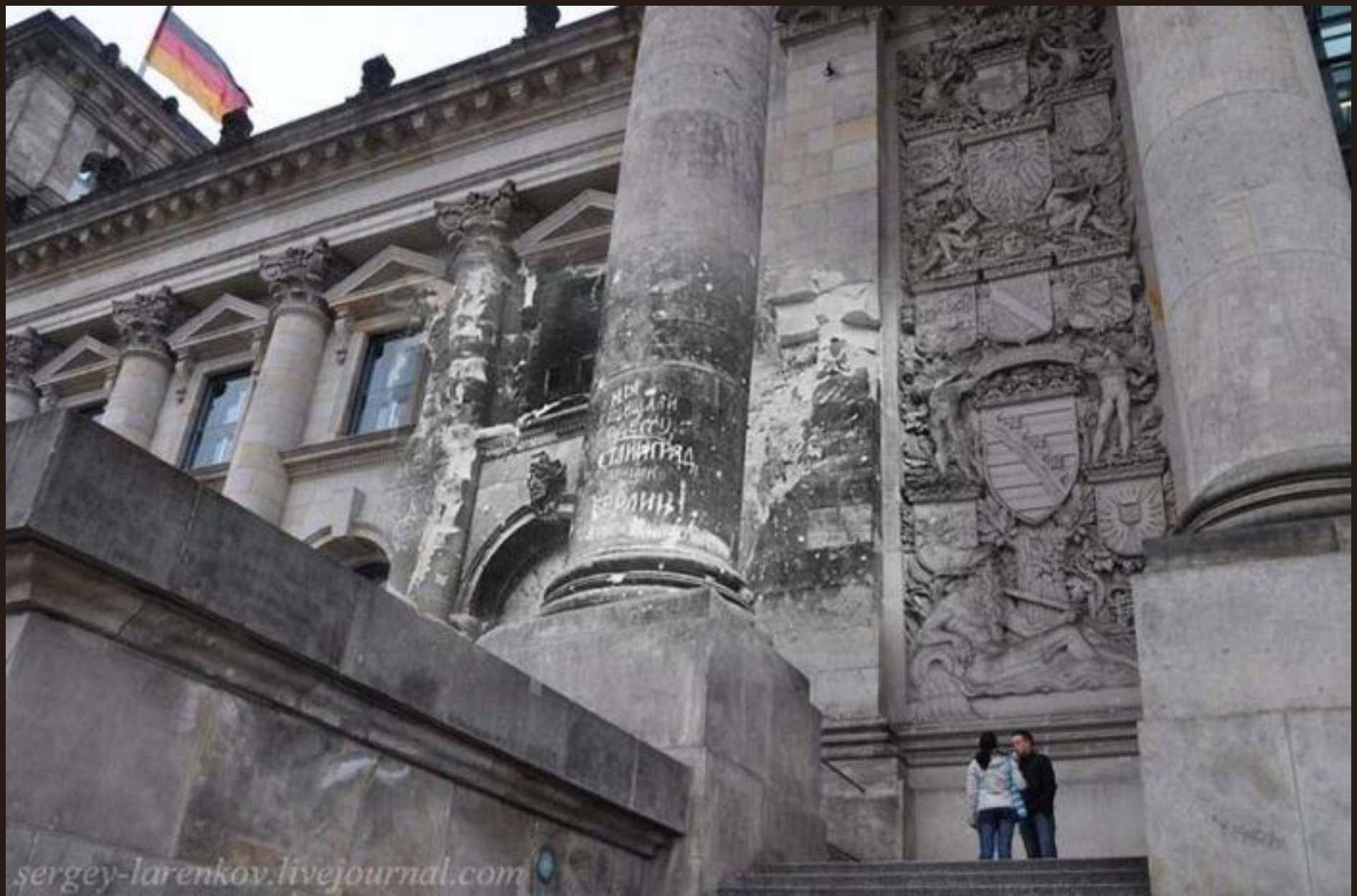
Берлин 1945/2010 Рейхстаг