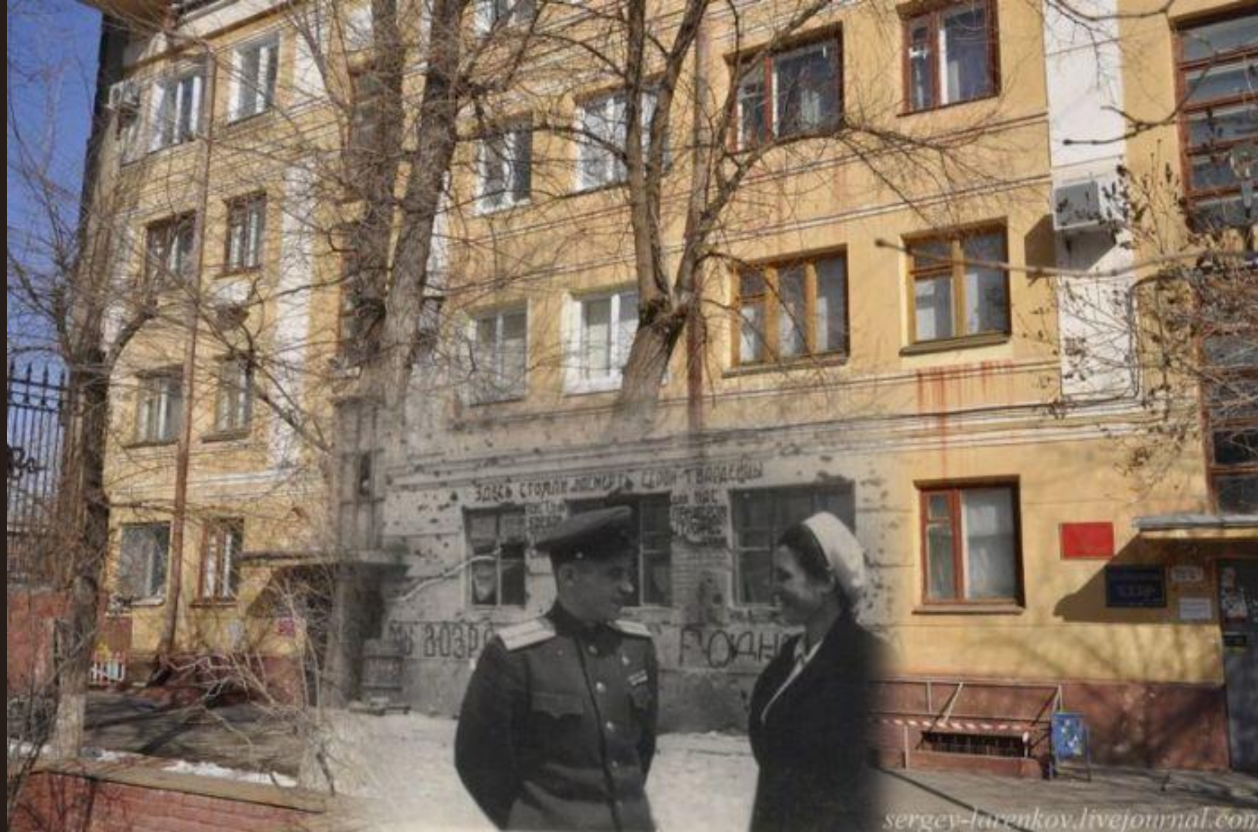
Я.Ф. Павлов (герой знаменитой обороны «Дома Павлова»)