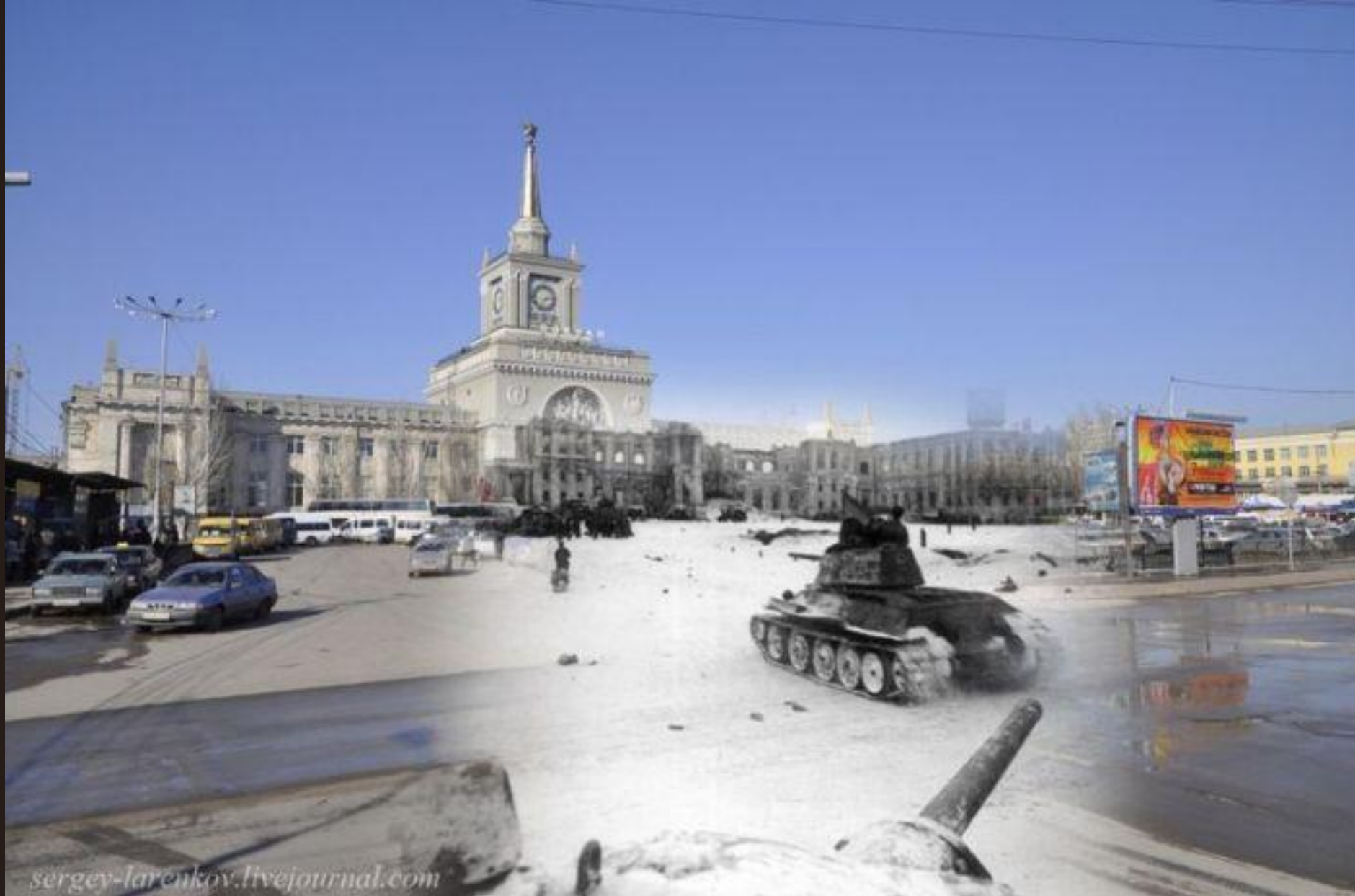
Советские танки Т-34 у вокзала. Вокзал также в ходе боев был сильно разрушен. После войны на его месте построен новый вокзал, мало чем напоминающий старый