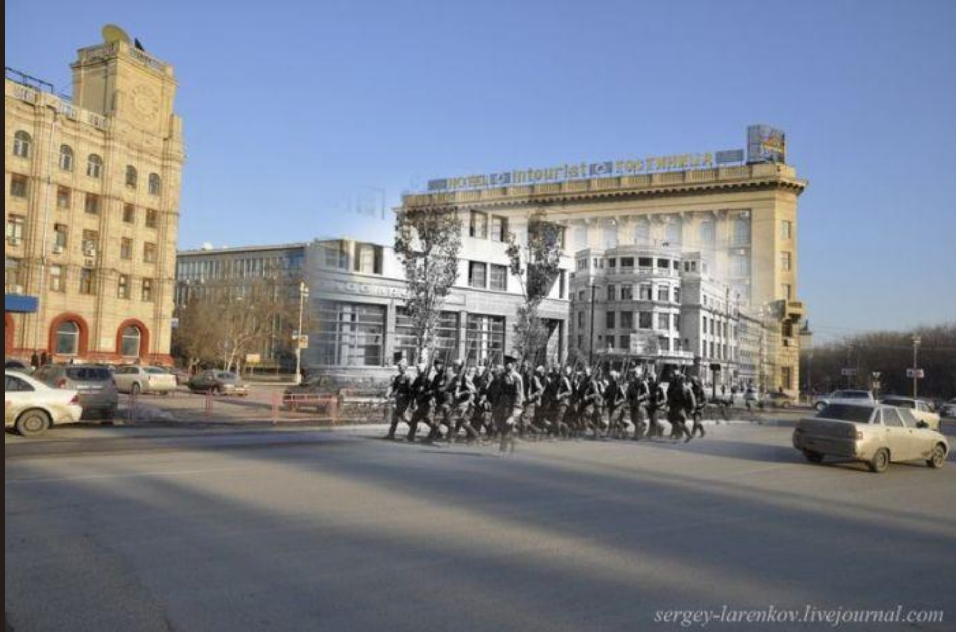
Угол гостиницы "Большая Сталинградская" и здание Универмага