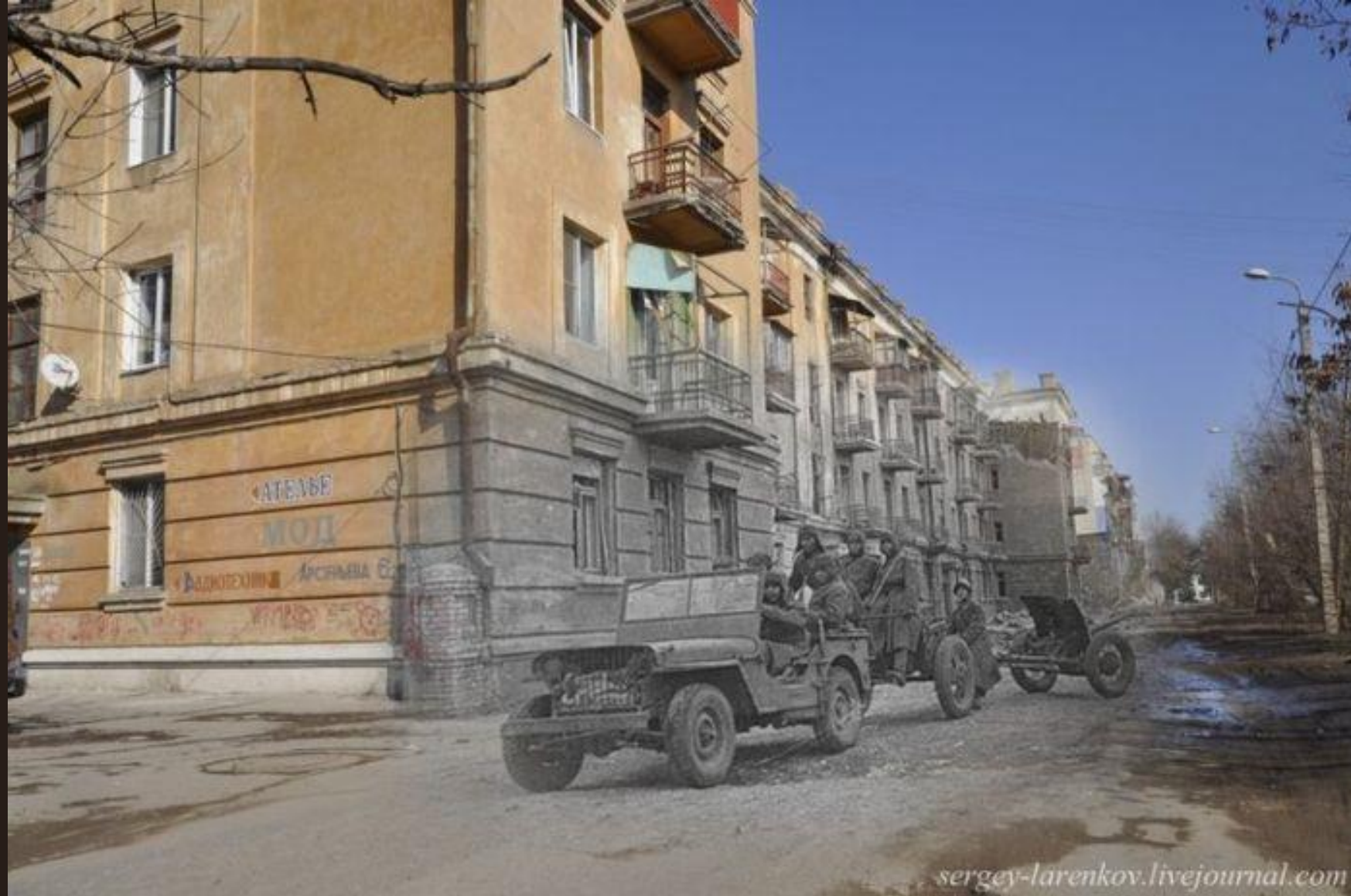
Ул. Арсеньева,6. Этот дом находится в южной части города, куда немец не дошел. Но следы разрушений на доме выделяются под современной краской