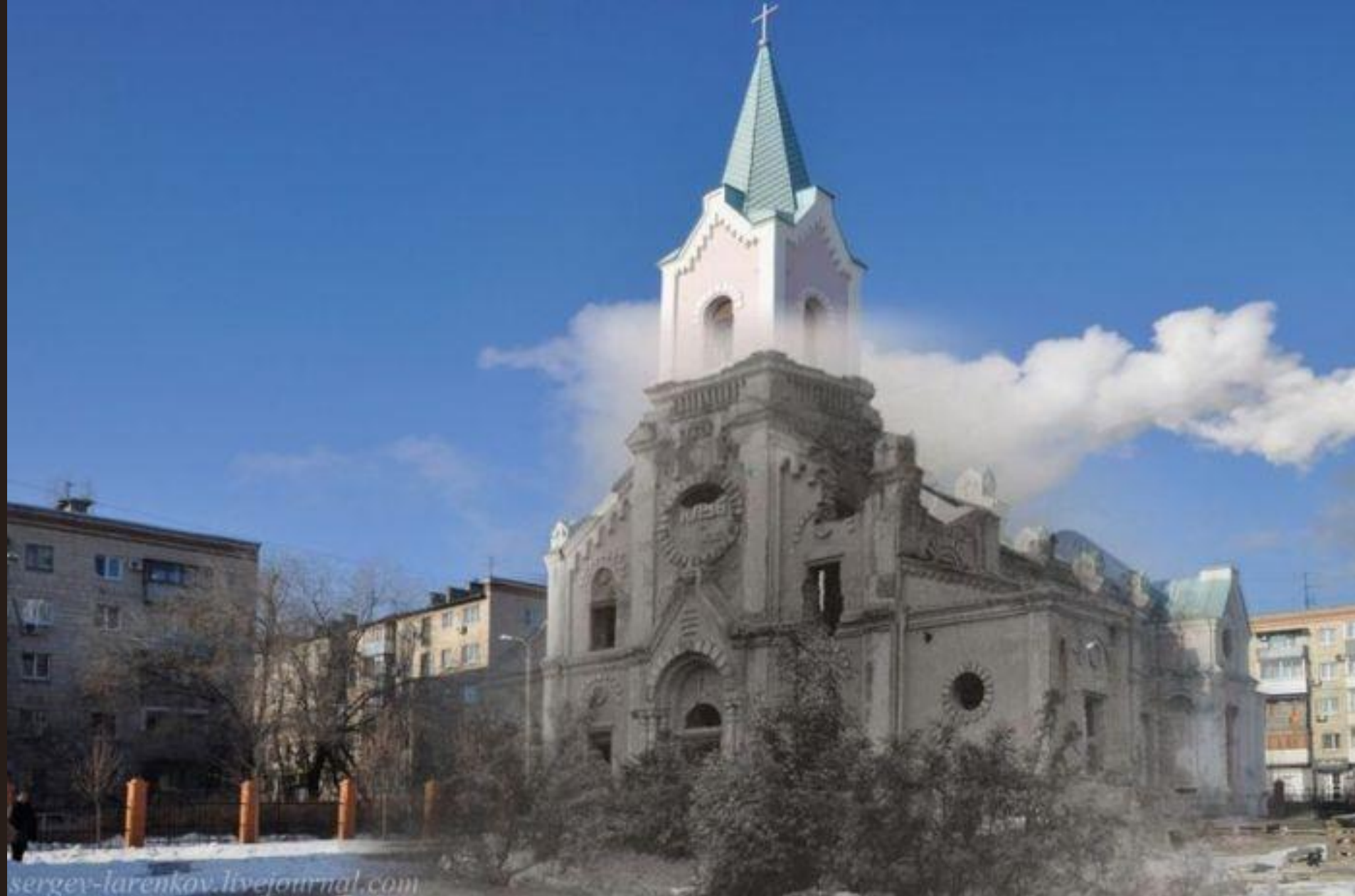
Клуб железнодорожников / Католический храм