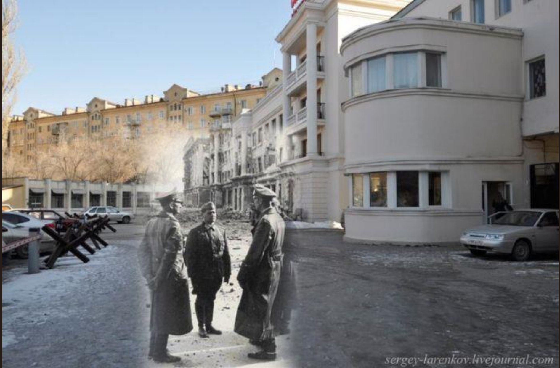
Паулюс в центре Сталинграда, ул. Островского