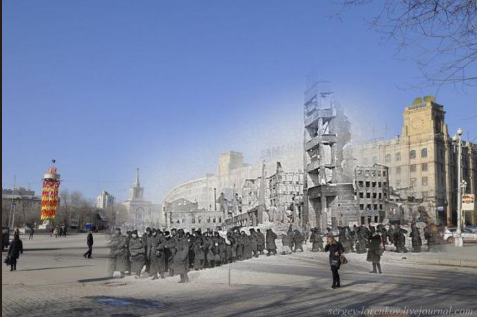
Пленные гитлеровцы на Площади павших бойцов. В сталинградском котле было взято в плен свыше 91 тысячи немецких солдат и офицеров, включая 24 генерала