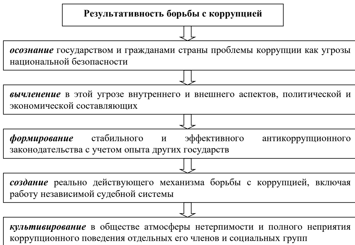
Схема 2. «Цепочка результативности» борьбы с коррупцией

Вместе с тем международный опыт борьбы с коррупцией показывает, что успех в ней зависит от целого ряда факторов, но в целом своеобразная «цепочка результативности» может быть представлена следующим образом (см. схему 2).